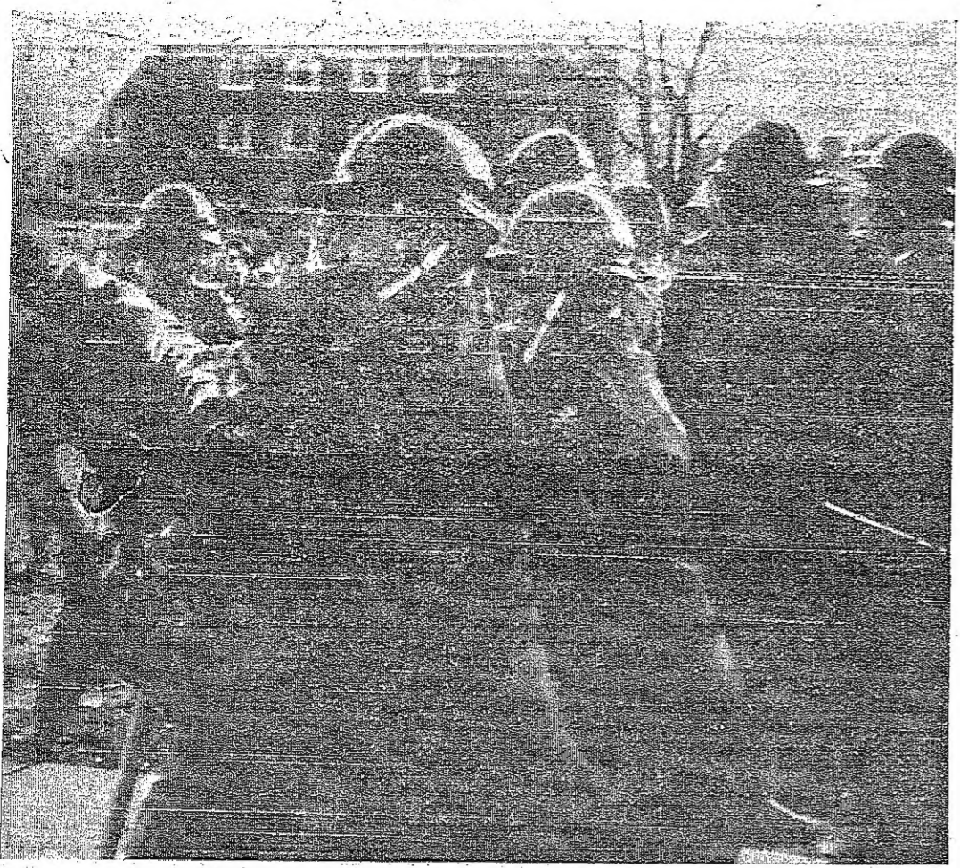
الحرس الوطني الاجري بداهجر جامعة كونستانت وقد اغتقل ١٢ طالبينا كان المسؤولون يقومون بعملية التفتيش

باريس - وصل عباس هويدا رئيس وزراء ايران الى باريس بعد ظهر امس في زيارة خاصة للعاصمة الفرنسية وقد استقبله علي ارض المطار مساعد مدير المراسم في وزارة الخارجية الفرنسية والمسفير الإيراني لدى فرنسا وسيسلم هويدا الى الولايات المتحدة جوا يوم الثلاثاء القادم ليحل ضيفا على الرئيس ليندون جونسون.